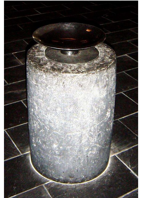
Taufstein und -schale in der Kirche Heilig Geist

Daher ist die Pfarrkirche der bevorzugte, weil sinnträchtigste, Ort für die Taufe Ihres Kindes. Sollten Sie den Wunsch haben, Ihr Kind an einem anderen Ort zu taufen, so kommen wir gerne darüber mit Ihnen ins Gespräch.